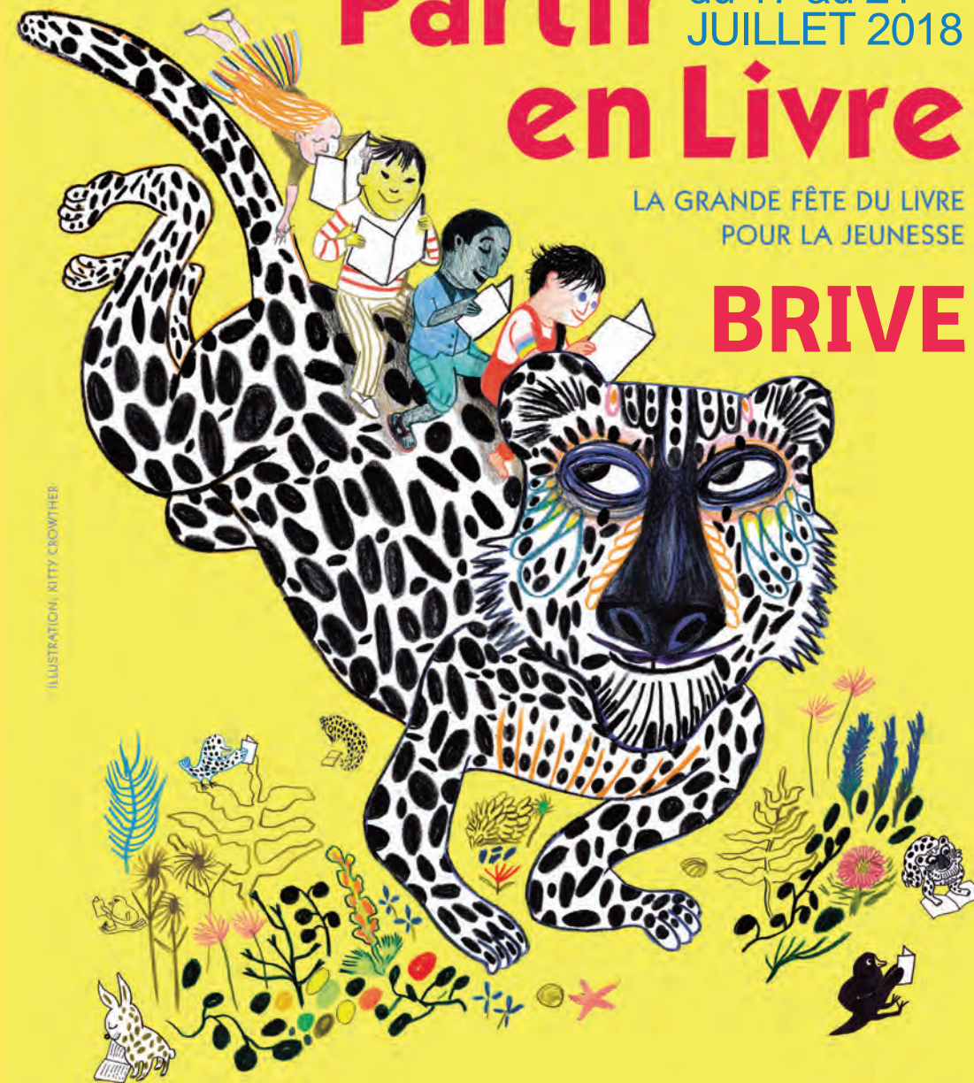
ILLUSTRATION: RITTY CROFTHER